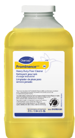
Prominence Heavy Duty Floor Cleaner