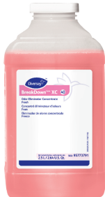
BreakDown™/MC XC Odor Eliminator Concentrate Fresh