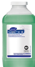
Tempest™/MC SC Solvent Free Cleaner Degreaser