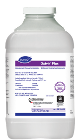
Oxivir® Plus Disinfectant Cleaner Concentrate