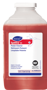
Spitfire® SC Power Bleach Cleaner