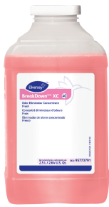
BreakDown™/MC XC Odor Eliminator Concentrate Fresh