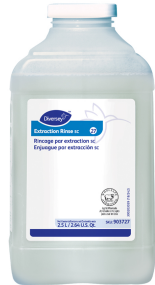
Extraction Rinse SC Extraction Rinse