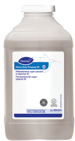
Heavy Duty Prespray SC Carpet Cleaning System