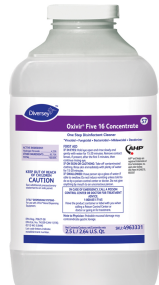
Oxivir® Five 16 Conc