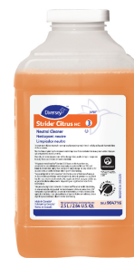
Stride® Citrus HC