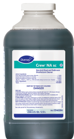
Crew® Non-Acid Bowl and Bathroom Disinfectant Cleaner