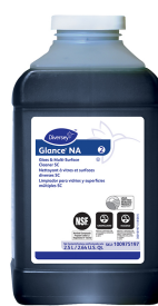
Glance® NA Glass and Multi-Surface Cleaner