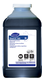
Glance® NA Glass and Multi-Surface Cleaner