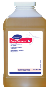
Good Sense® HC No Soap Liquid Counteractant Concentrate