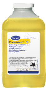
Prominence Heavy Duty Floor Cleaner