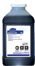
Glance® NA Glass and Multi-Surface Cleaner