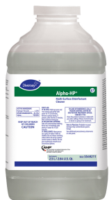
Alpha-HP® Multi-Surface Disinfectant Cleaner