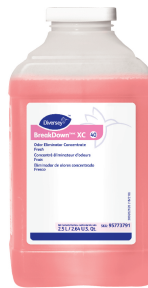
BreakDown™/MC XC Odor Eliminator Concentrate Fresh