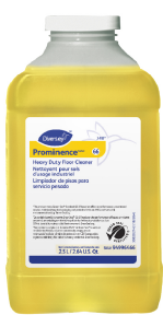
Prominence Heavy Duty Floor Cleaner