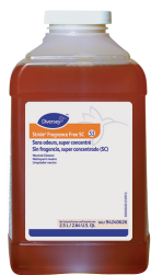
Stride® Fragrance Free Neutral Cleaner