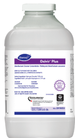
Oxivir® Plus Disinfectant Cleaner Concentrate