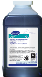
Crew® Bathroom Cleaner Scale Remover