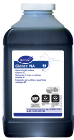
Glance® NA Glass and Multi-Surface Cleaner