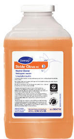
Stride® Citrus HC

Cleaning Products / Productos de Limpieza / Produits de Nettoyage