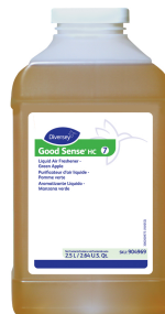
Good Sense®HC Liquid Odor Counteractant Concentrate