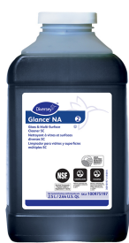
Glance® NA Glass and Multi-Surface Cleaner