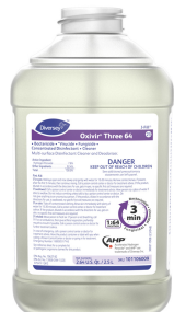
Oxivir® Three 64 Concentrate