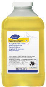
Prominence Heavy Duty Floor Cleaner