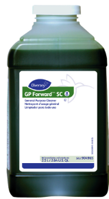
GP Forward® SC Scrub and Recoat General Purpose Cleaner